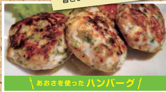
あおさを使ったハンバーグ /