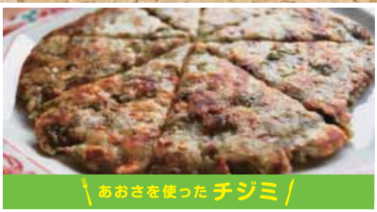
あおさを使ったチジミ /

栄養価の高いあおさでチジミや簡単料理を親子で作ろう!! あおさで作るおにぎり・味噌汁・チジミ・ハンバーグを つくり、自然の恵みと環境について考えよう!! 皆さまのご参加を心からお待ちしております。